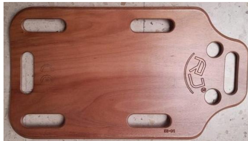
Fotografía inspección previa

La muestra es referenciada en AIDIMME como 2207138-04.