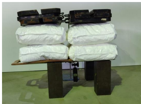
Imagen tomada durante el ensayo